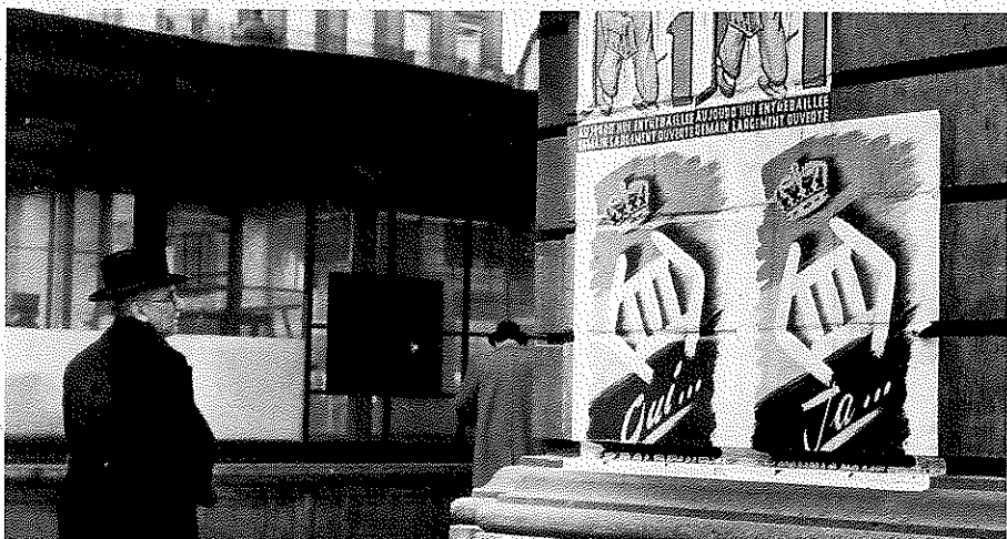
Tweetalige affiche die oproept om voor de koning te stemmen in de volksraadpleging.

Vanden Berghe: Om twee redenen: de haven van Antwerpen en de uraniummijn in Belgisch Kongo. België had namelijk een geheim akkoord afgesloten met de Ver- enigde Staten waardoor zij al het Kongo- lese uranium kregen. De Amerikanen waren